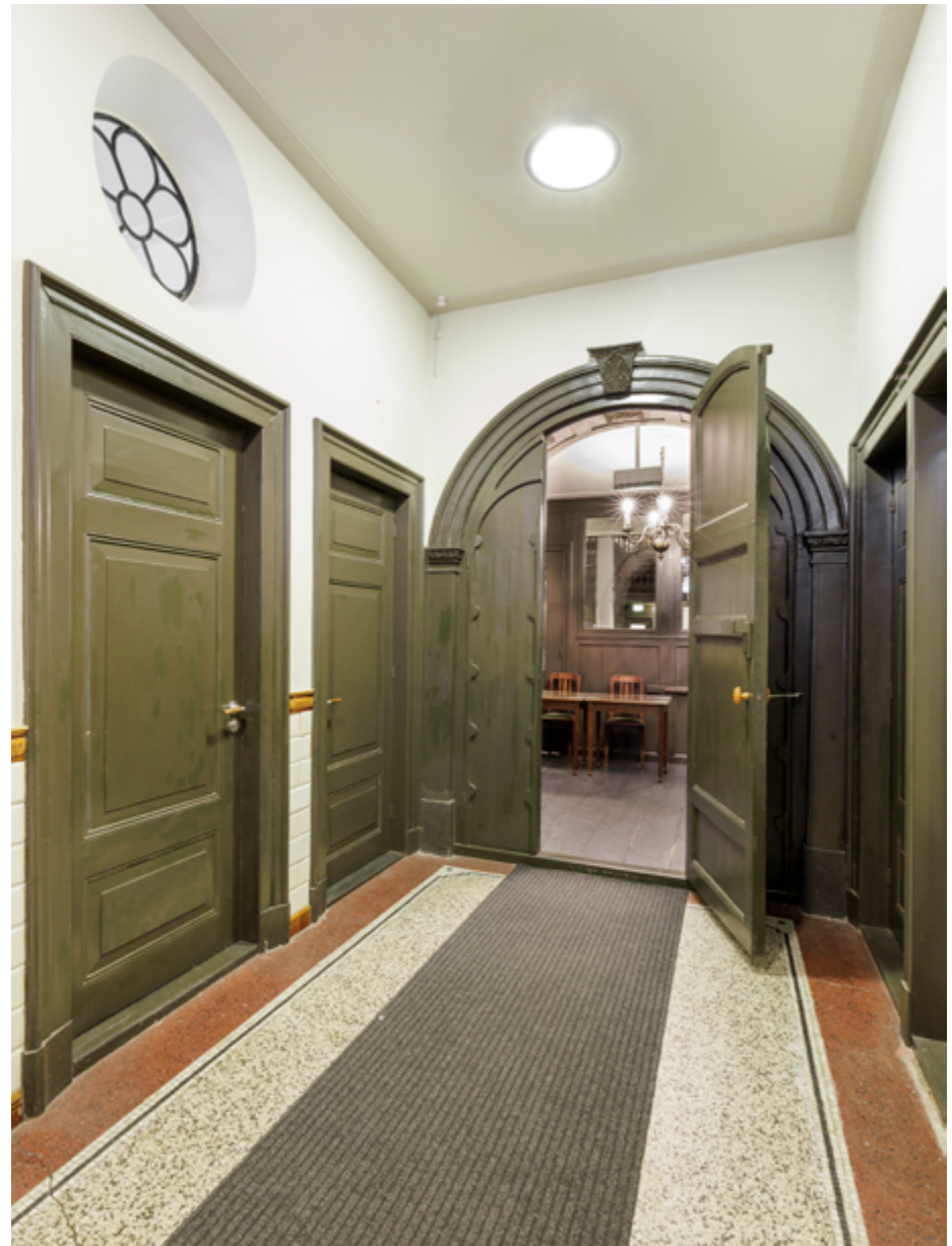
De evangelisch-lutherse schuilkerk in Groningen ligt verscholen achter een woonhuis uit 1874 dat een voorganger verving. Kerkgangers betreden de zaalkerk via de hal van de woning.

Naarmate de tolerantie van de overheid verder toenam, werden de verborgen kerken in de steden groter en inwendig representatiever, voorzien van groot meubilair en van decoraties al naar gelang de gezindte. Wat uitwendig niet was toegestaan, kon aan de binnenkant ruimschoots worden gecompenseerd. In de kerken van de reformatorische gezindten koos men over het algemeen voor ingetogen en deftig houten meubilair. Deze kerkmeubels werden uitgevoerd in classicistische en barokke stijl met bijpassende geelkoperen en zilveren gebruiksvoorwerpen. Ook orgels namen vanaf circa 1700 een belangrijke plaats in. Met name bij de katholieken kunnen we spreken van een grote, naar binnen gerichte barokke rijkdom met altaaropstanden, orgels, zilverwerk en veelkleurige schilderijen en gewaden. Door de grote toeloop van gelovigen werd er gewoekerd met ruimte en bracht men galerijen aan, soms meerdere boven elkaar. Hiervoor werden soms vernuftige constructies bedacht, die niet overal even betrouwbaar bleken. Zo leidden ondoordachte ingrepen in de oudkatholieke Gertrudiskapel te Utrecht bijna tot