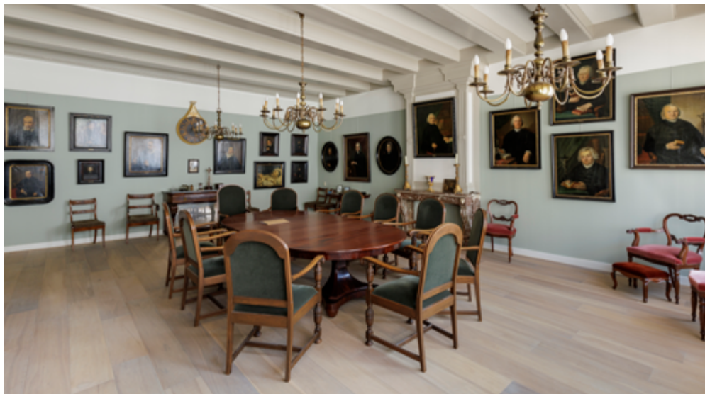
In de regentenkamer in de pastorie bevindt zich een rijke collectie priesterportretten, die samen getuigen van de actieve geloofsuitoefening en de sterke traditie in deze schuilerkerk.