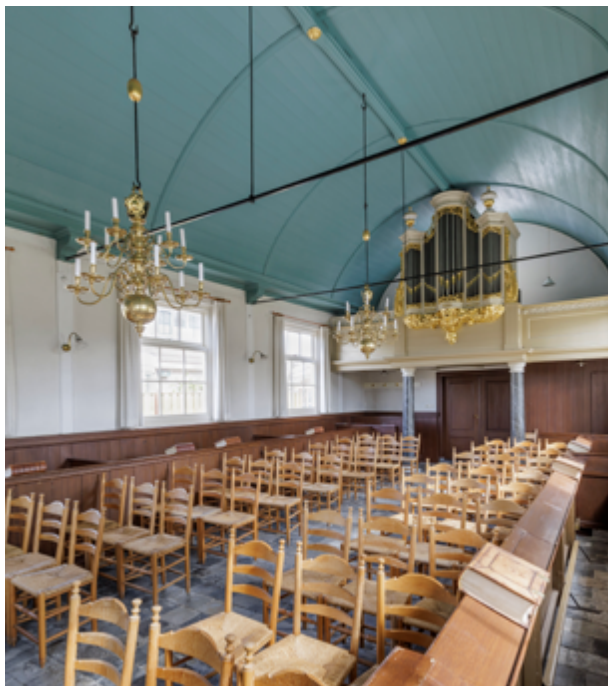
Zicht vanaf het liturgisch centrum naar de orgelbalustrade met het orgel boven de toegang van de kerk.