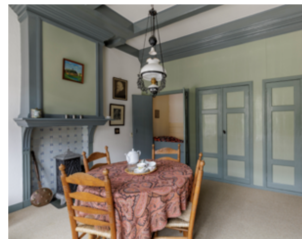
Kosterij en kerk zijn tegenwoordig een museum. De inrichting van de voorkamer is niet meer origineel. Het is een reconstructie van een woonvertrek uit die tijd en dient als tentoonstellingsruimte voor de doopsgezinden en hun geschiedenis.