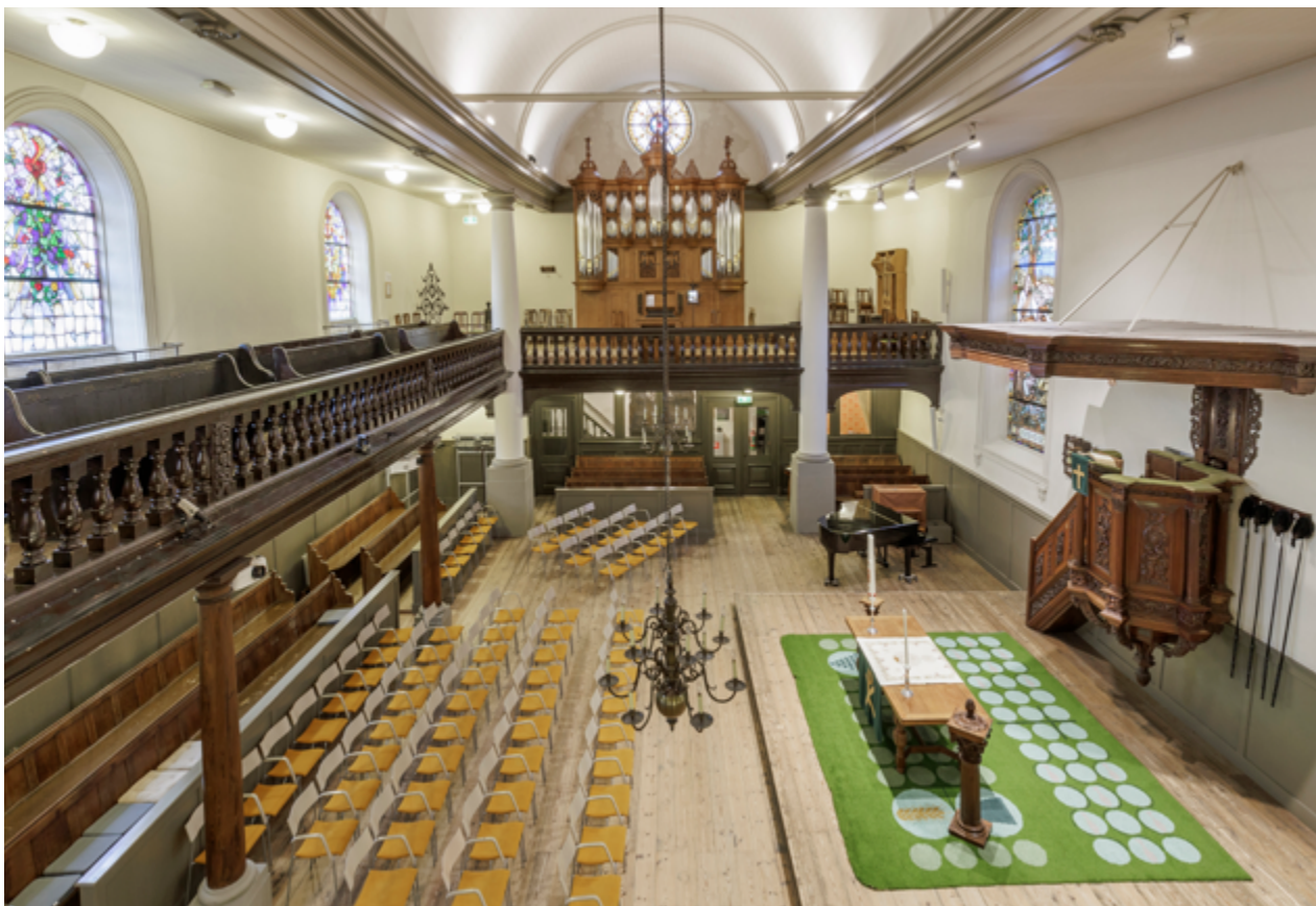
Het rechthoekige kerkinterieur met aan drie zijden galerijen wordt overspannen door een tongewelf. De centrale preekstoel met gesneden decoraties dateert uit 1696 en is vervaardigd door Allert Meijer en Jan de Rijk.

voorstellingen en symbolen die de geloofsbeleving van de lutherse gemeente illustreren. Die aan weerszijden van de preekstoel tonen aan de ene zijde Christus die een van de zaligsprekingen doet, en aan de andere zijde Maarten Luther op de Rijksdag van Worms. Beide ramen werden in 1917 vervaardigd door atelier Koelewijn en Van der Ent te Amsterdam.