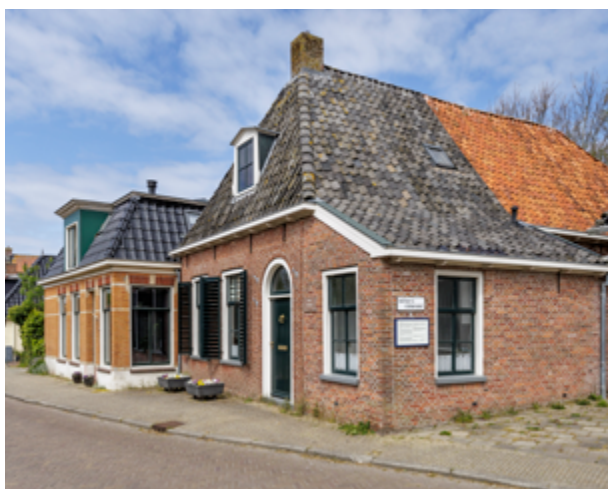
De huizenrij aan de Grote Buren in Pingjum. Het woongedeelte van deze huizen is voorzien van zwarte dakpannen. Daarachter ligt de kerkzaal, die met rode pannen is gedekt.