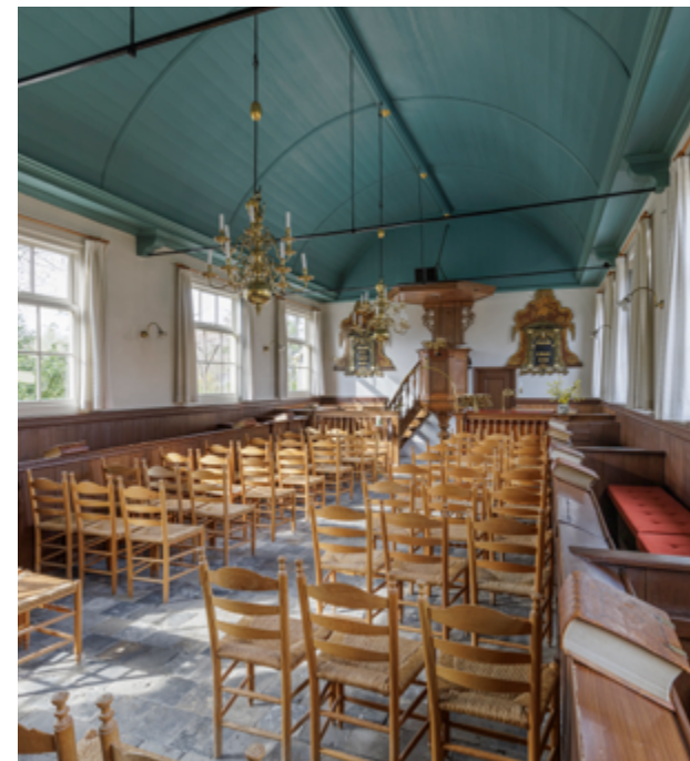
De remonstrantse schuikerkerk in Oude Wetering is een kleine rechthoekige zaalkerk met een tongewelf. Langs de wanden zijn eenvoudige kerkbanken geplaatst met op de lezelaars negentiende-eeuwse Bijbels.