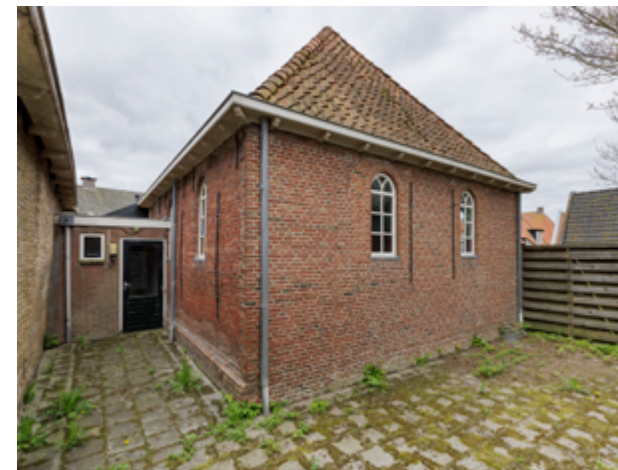
De vermaning in Pingjum gaat schuil achter de kosterij.