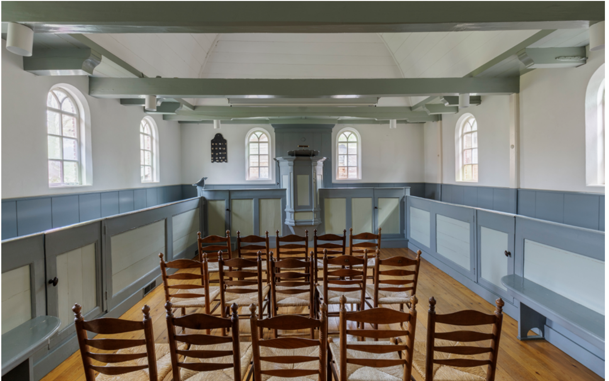
Achter de kosterwoning ligt de voormalige kerkruijme, een intiem zaaltje dat zich kenmerkt door eenvoud. Langs de wanden staan banken voor de mannen, in het midden stoelen voor de vrouwen.