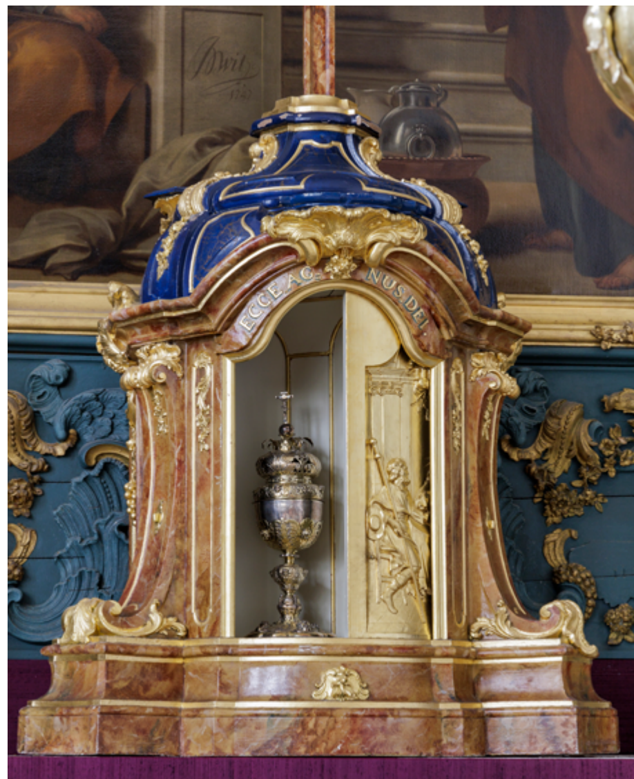
Rooms-katholieke en oudkatholieke schuilkerken werden gedurende de zeventiende en achttiende eeuw uitbundig ingericht en gedecoreerd. In de oudkatholieke kerk in Delft is het verguld houten tabernakel uit het midden van de achttiende eeuw een echte blikvanger.

Het meest beducht was de overheid voor de rooms-katholieken, de oude bestrijders van de Reformatie. Zij werden geassocieerd met het Spaanse bewind, waarmee de Republiek tot 1648 in staat van oorlog verkeerde, en zij stonden onder leiding van een buitenlandse vorst, namelijk de paus van Rome. Bovendien bleef een groot deel van de bevolking in de Republiek lange tijd trouw aan het rooms-katholieke geloof. De verordeningen van de overheid tegen de katholieken lijken aanvankelijk net wat strenger dan tegen de andere gezindten. Zo worden in diverse uitgevaardigde plakkaten (verordeningen) de katholieken steeds met name genoemd, apart van de andere ‘secten’ en ‘gesintheden’. Maar ook hier werd de soep niet zo heet gegeten als ze werd opgediend. In een plakkaat van de Staten-Generaal dat in 1651 in Den Haag werd vastgesteld, stond zwart op wit dat de clandestiene genootschappen, waaronder de katholieken, oogluikend werden toegestaan op de plaatsen waar ze op dat moment al aanwezig waren. 4 Toen na het rampjaar 1672 duidelijk werd dat de katholieken goede vaderlanders waren en geen overlopers die partij voor de katholieke bezetters kozen, werd de tolerantie