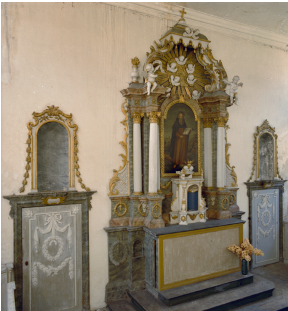
Kasteel Ter Horst in Loenen op de Veluwe heeft een rooms-katholieke schuilkapel. De kapel op deze adellijke buitenplaats heeft een barok altaar met altaarschilderij, zuilen, verguldsel en engelenkopjes.

van overheidswege nog groter, maar nergens zo groot dat men uit de schuil- en schuurkerken mocht komen.