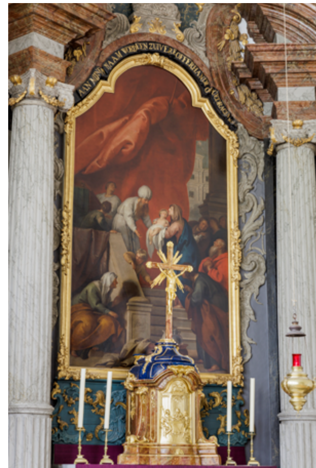
Op het hoofdaltaar staat een verguld houten tabernakel met een voorstelling van de Emmaüsgangers. Het altaarstuk uit 1747 met een verbeelding van de Presentatie van Jezus in de tempel is van de hand van de vermaarde kunstenaar Jacob de Wit.