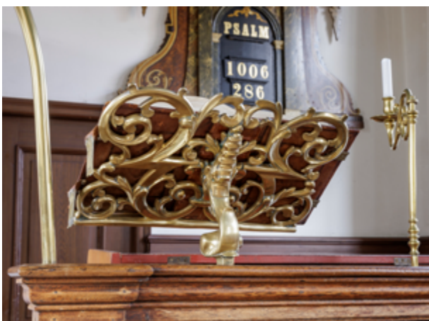
Het rijke decoratieve koperwerk in de remonstrantse schuikerkerk stamt uit de eerste helft van de achttiende eeuw.