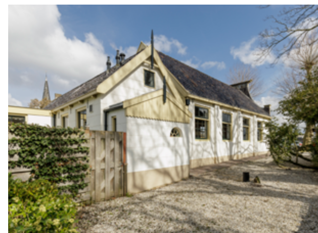
Het kerkje heeft aan de zijkant en achterzijde de uitstraling van een woonhuis en is daardoor als kerk niet of nauwelijks herkenbaar.