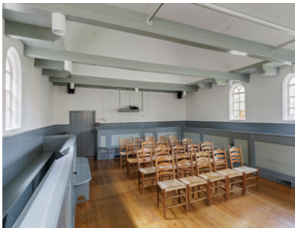
De kerkzaal zonder orgel heeft een houten tongewelf en hooggeplaatste, kleine rondboogvensters.

De inrichting is uiterst sober en juist daardoor exemplarisch voor de beginselen van de mennonieten. Tegen de voorzijde van de kerk van Pingjum is een bescheiden woonhuis met negentiende-eeuwse voor-gevel (de voormalige kosterwoning) gebouwd. Vanuit deze woning is de eigenlijke kerk te bereiken. Het betreft een rechthoekige, van een tonggewelf voorziene kerkruimte met houten trekbalken. Tegen de wanden staan eenvoudige geschilderde kerkbanken, waarschijnlijk uit de achttiende eeuw, waarin aan één zijde een classicistische preekstoelkuip met voorzangerslezenaar is opgenomen. In de doopsgezinde kerkinterieurs maakt de preekstoel meestal onderdeel uit van de flankerende kerkenraadsbanken om tot uitdrukking te brengen dat de predikant uit de kerkenraad voortkomt. In Pingjum zijn in de centrale ruimte tussen de banken losse stoelen geplaatst. Er is nooit een orgel in deze kerk aanwezig geweest. Ook dit hoorde bij de oorspronkelijke eenvoud van de doopsgezinde bijeenkomsten. In de twintigste eeuw is er wel enige tijd gebruikgemaakt van een harmonium. De kerk is niet meer als zodanig in gebruik en fungeert nu als Menno Simonsmuseum waar een historisch vermaningsinterieur kan worden bezocht. Deze schuilkerk toont dus weliswaar geen verborgen schatten, maar is in zijn absolute eenvoud een waardevol voorbeeld van een authentiek doopsgezind schuilkerkinterieur.