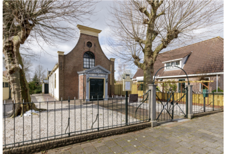
De remonstrantse schuilkerk in Oude Wetering bevindt zich een flink stuk achter de rooilijn. Tot 1819 stond ervoor een kleine pastorie waardoor de kerk vanaf de straat oorspronkelijk niet zichtbaar was.

Omdat het plaatselijke overheden in de Republiek al snel duidelijk werd dat een streng repressief beleid niet gewenst en ook niet te handhaven was, koos men voor een gedoogbeleid ten aanzien van de andere religies en hun kerkgebouwen. Daarbij was de houding ten opzichte van de clandestiene genootschappen lang niet overal eensluidend en hing ze af van plaatselijke magistraten. Bovendien werd het ene genootschap eerder getolereerd dan het andere. Over het algemeen was men het meest coulant tegenover lutheranen 1 en doopsgezinden. 2 Beide reformatorische gezindten wonnen pas tegen het einde van de