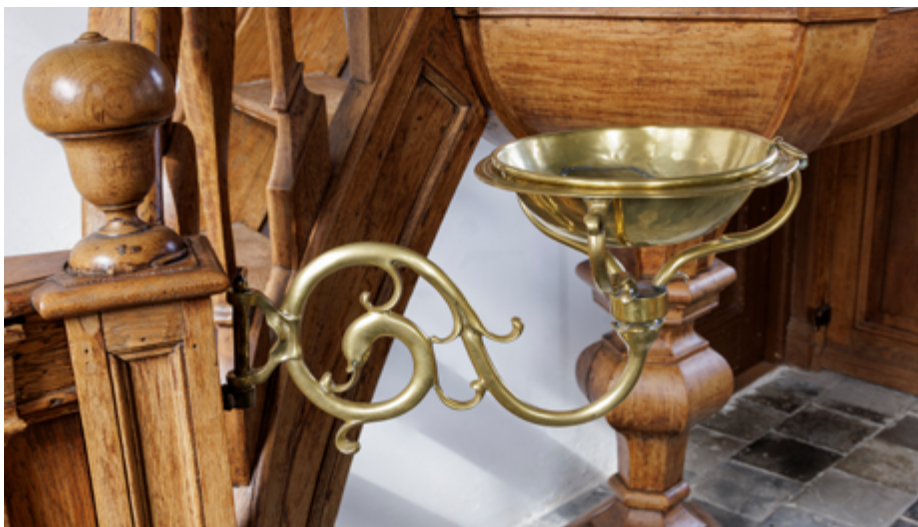
De buitenkant van schuilkerken was weliswaar sober en onuitsproken, het interieur daarentegen werd herkenbaar aangekleed en ingericht voor de eigen eredienst. Het achttiende-eeuwse koperen doopbekken heeft nog steeds een plaats aan de preekstoeltrap in de remonstrantse kerk in Oude Wetering.

instorting van het gebouw. Als het aantal gelovigen minder werd, konden de galerijen trouwens even gemakkelijk weer worden afgebroken.